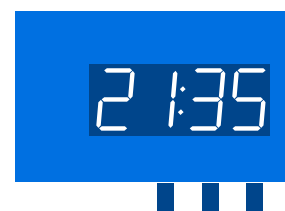
Widok od frontu

Pod zegarem LED są trzy przyciski, przyciśnięcie prawego na 2 s powoduje przejście w tryb ustawiania (cyfry na zegarze migają), lewy zmniejsza wartości a środkowy zwiększa wartość. Przejście do ustawień następnego parametru - przycisk prawy. Wyjście z trybu ustawiania - przycisk prawy przez 1-2 s.